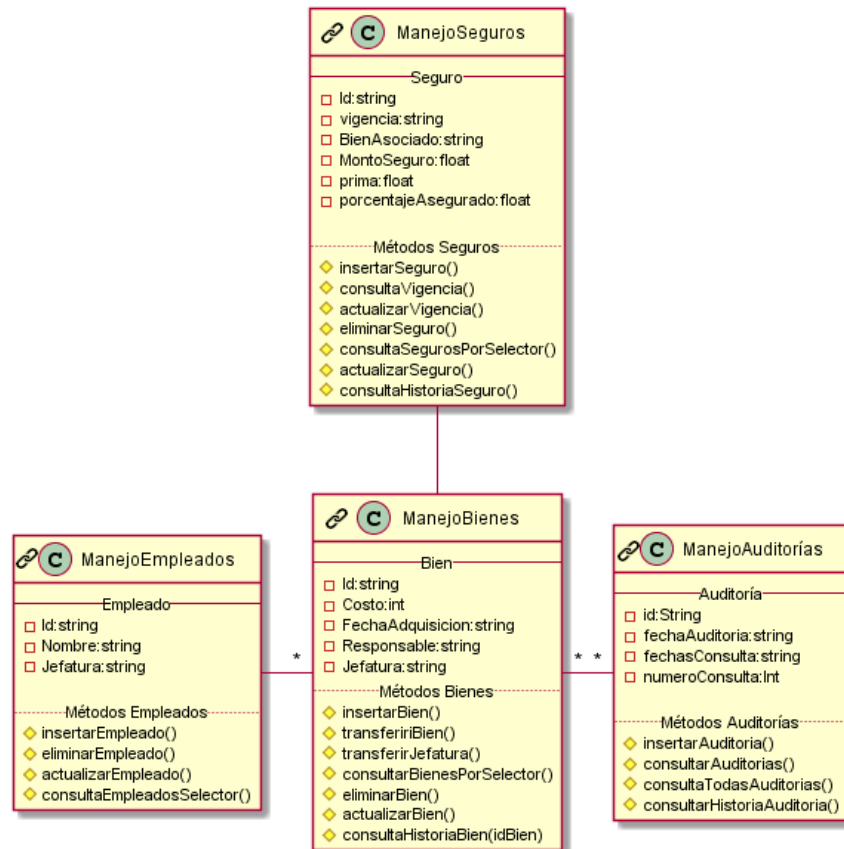
Fig. 3: Contratos inteligentes: ManejoBienes , ManejoAuditorías , ManejoSeguros y ManejoEmpleados .

Para documentar el contrato inteligente se utilizó un diagrama de clases perteneciente a UML, añadiendo un ícono en la esquina superior izquierda como se sugiere en (Rocha H., y Ducasse S., 2018). Dicho ícono nos indica que se refiere a un contrato inteligente.